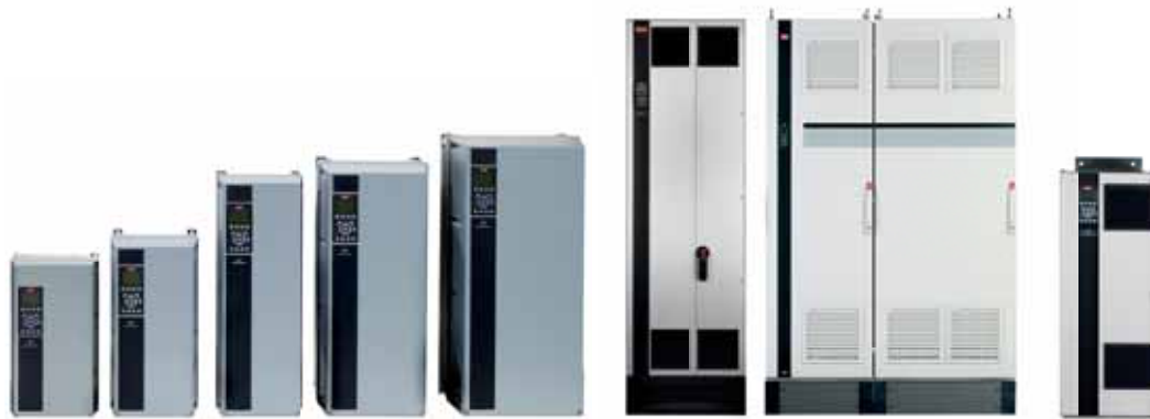
VLT® AutomationDrive FC 302, VLT® AQUA Drive FC 202 y VLT® HVAC Drive FC 102