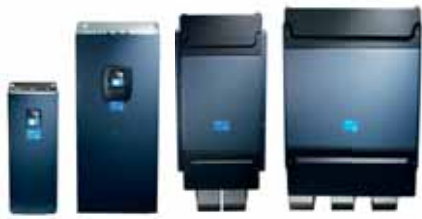
VACON® NXP Air Cooled