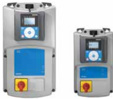
VACON® 20 X