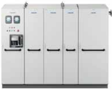
VACON® NXP Liquid Cooled Enclosed Drive