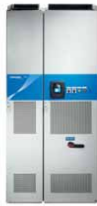
VACON® NXC Air Cooled Enclosed Drives