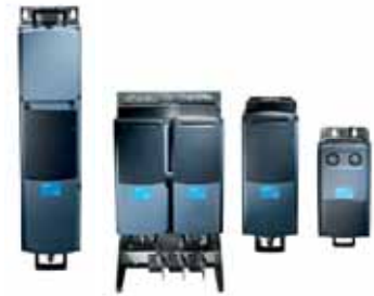
VACON® NXP Liquid Cooled Drive