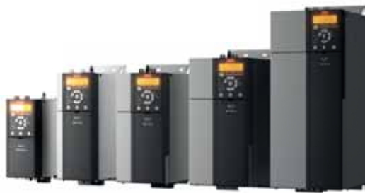
VLT® Midi Drive FC 280