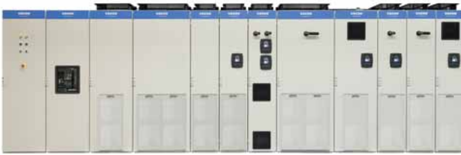
VACON® NXP System Drive