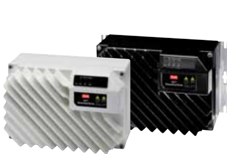
VLT® Decentral Drive FCD 302