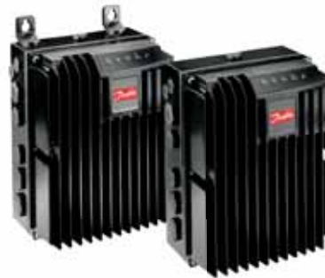
VLT® Decentral Drive FCD 300