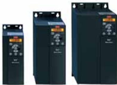
VLT® Micro Drive FC 51