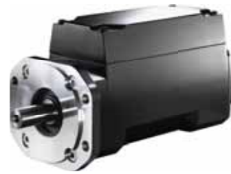
VLT® Integrated Servo Drive ISD 410 System