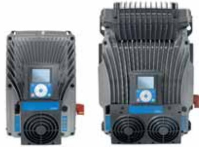
VACON® 100 X