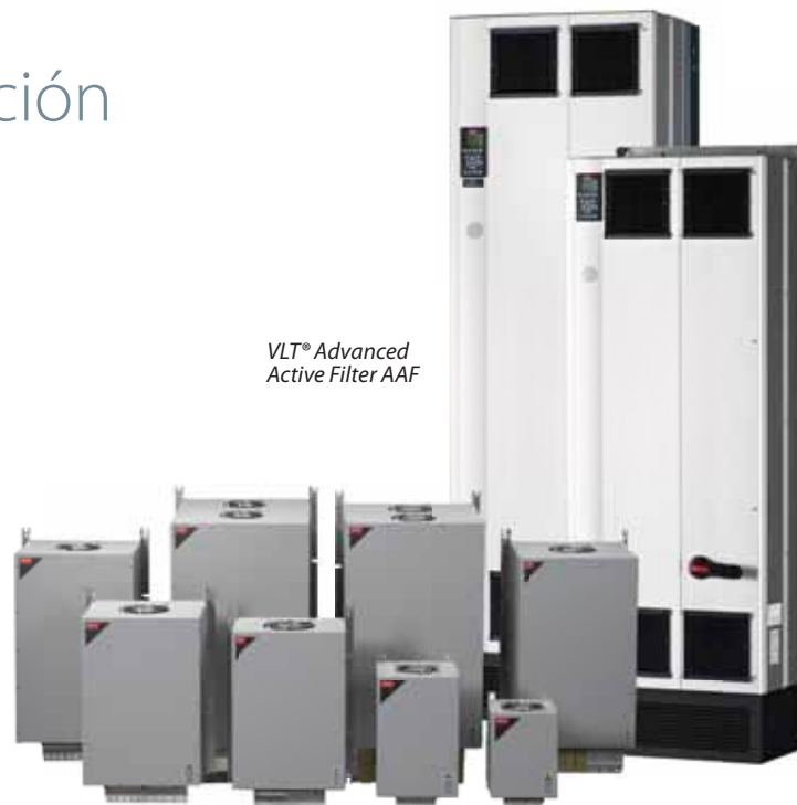
VLT® Advanced Active Filter AAF