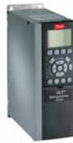
VLT® Refrigeration Drive FC 103