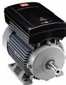
VLT® DriveMotor FCM 300