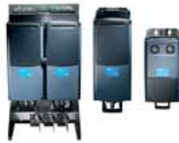
VACON® NXP Liquid Cooled Common DC Bus