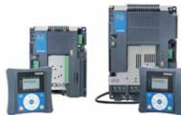
VACON® 20 Cold Plate