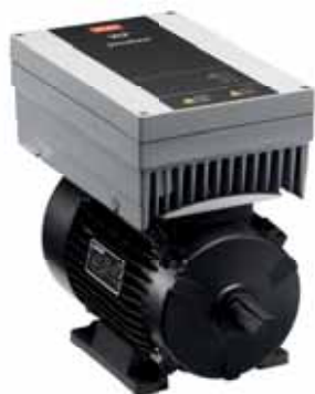
VLT® DriveMotor FCM 106