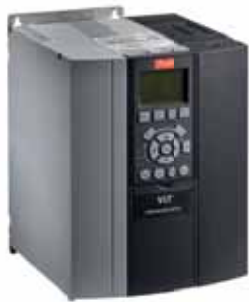
VLT® Lift Drive LD 302