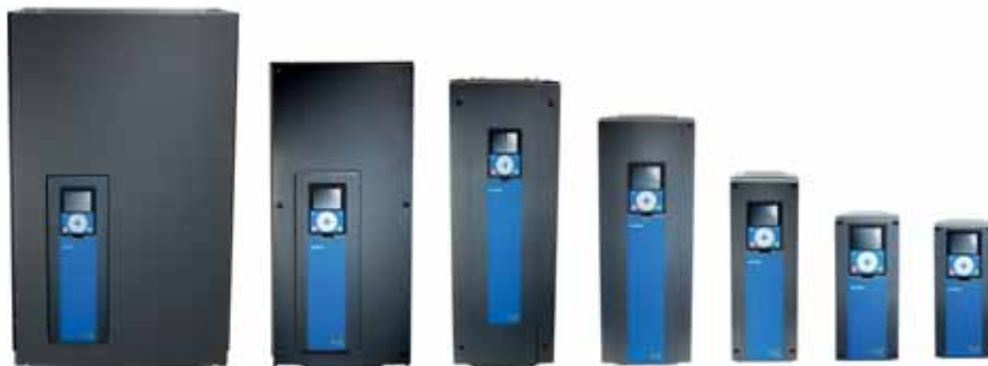
VACON® 100 INDUSTRIAL, VACON® 100 FLOW y VACON® 100 HVAC