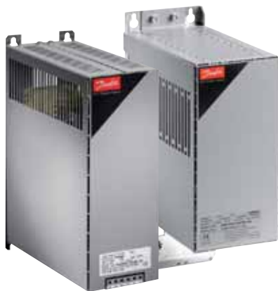
VLT® dU/dt Filters