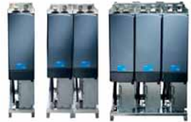
VACON® NXP Grid Converter