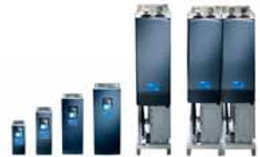
VACON® NXP Common DC Bus